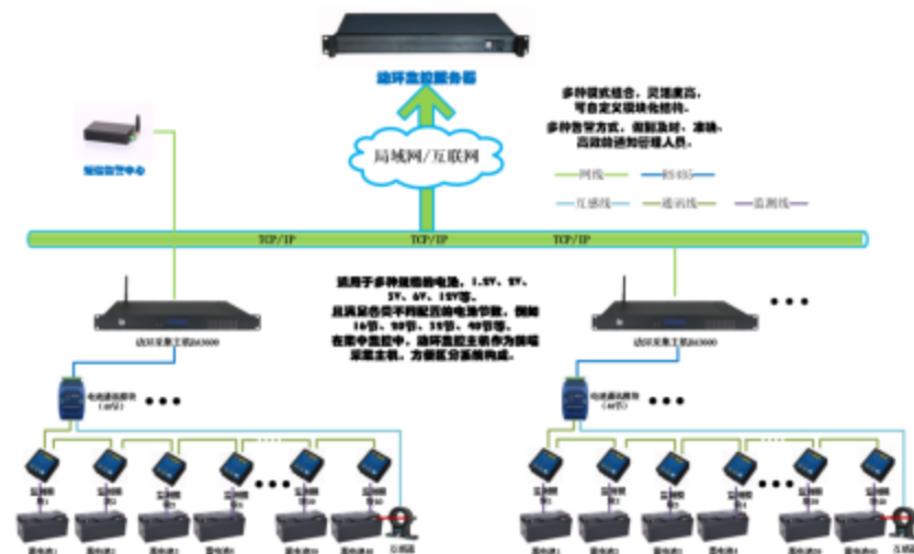
图 1 电池监控系统图

动环监控主用于采集电池的各项数据并通过互联网的形式传输监控数据，用户可通过局域网中终端服务器登录 WEB 界面观测电池运行情况（包括电压、电流、温度、内阻等），也可配置一个 10 寸触摸屏，提供给现场管理人员直接设置与查看，现场电池状态。可以接入每组最大电池节数限定为 40 节，最大支持 4 组 160 节电池同时检测。支持单组 16 节、20 节、32 节等监控模式。