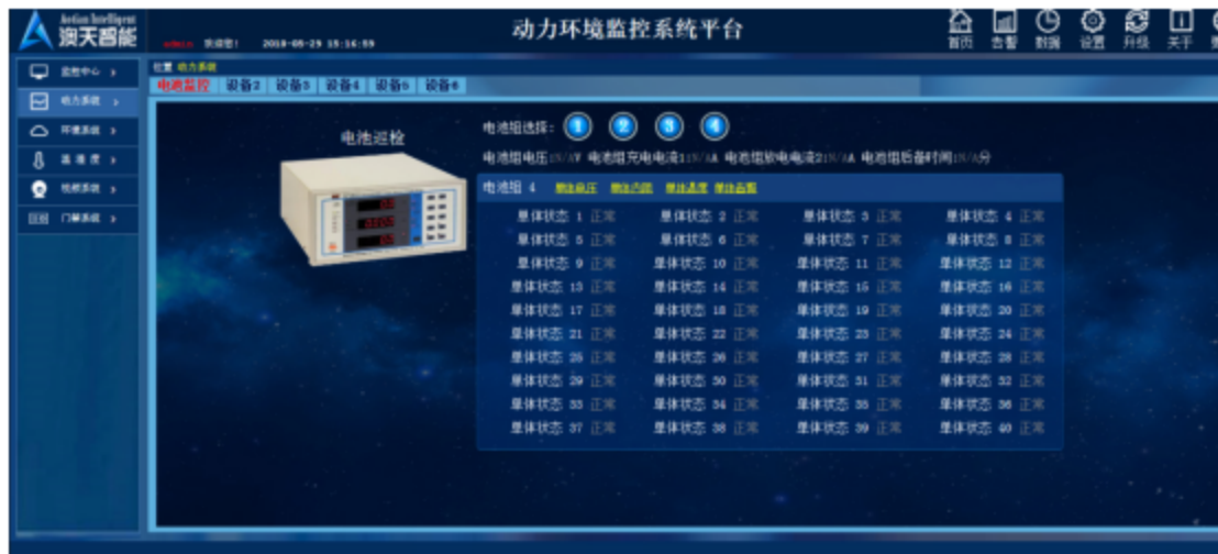
图8 电池监控状态界面图