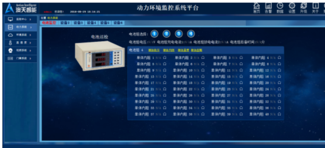
图9 电池监控内阻界面图