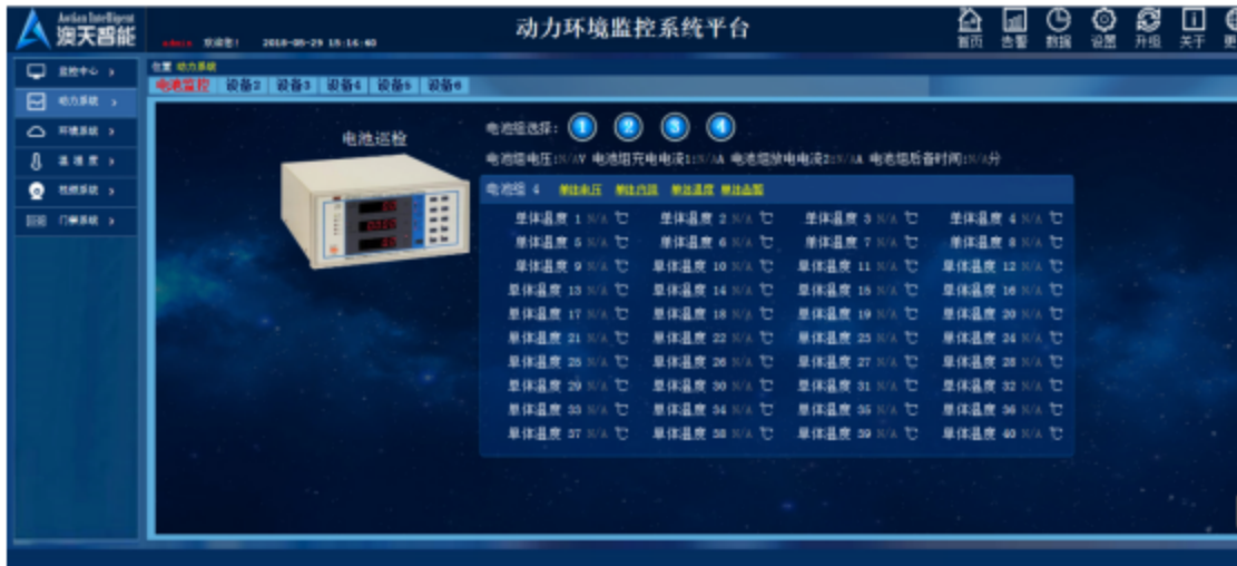
图 11 电池监控温度界面图