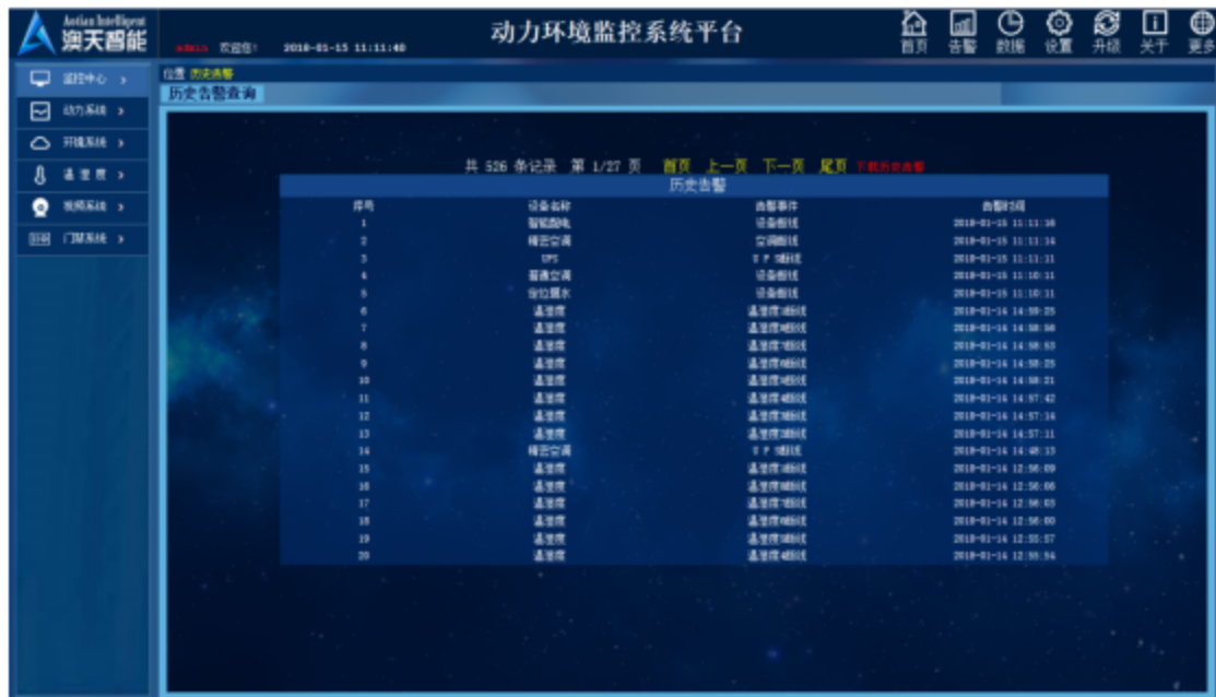
图 13 历史告警界面图