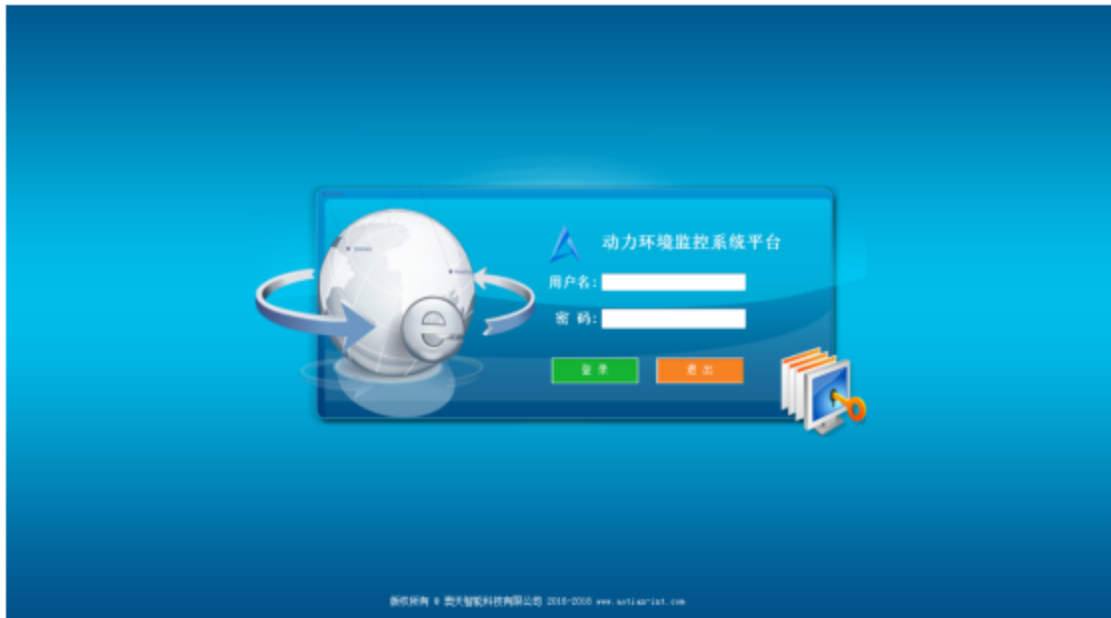
图 6 登录界面图

本系统为 B/S 架构，用 IE 或者其他浏览器打开，缺省 IP: 192.168.0.100 企业号为空帐号与密码均为 admin。