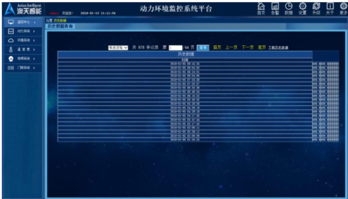
图 12 历史记录界面图