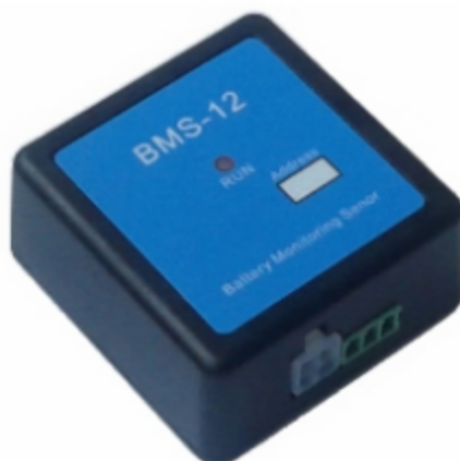
图 5 AT-BMS12-2 电池检测管理模块图