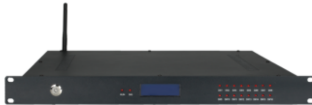
图3 RTU-2000 动环监控主机图