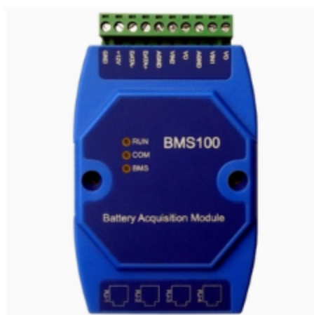
图 4 AT-BMS100 电池通信管理模块图